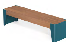
FOLA - P