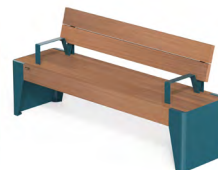
FOLA - S + 2 B

Panca composta da due spalle in lamiera d'acciaio sp. 4 mm con seduta composta da 11 listoni di legno duro o pino termo-trattato di sezione 40x40 mm e 32x130 mm su di un telaio in tubolare d'acciaio 60x40x2 mm e cerniere in lamiera piegata sp. 4 mm