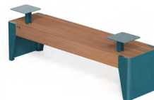
FOLA - P + 2 T