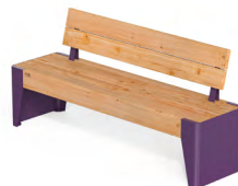
FOLA - S