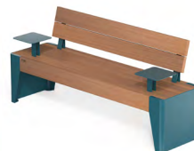
FOLA - S + 2 T