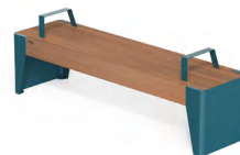
FOLA - P + 2 B